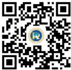
中文专题网址二维码