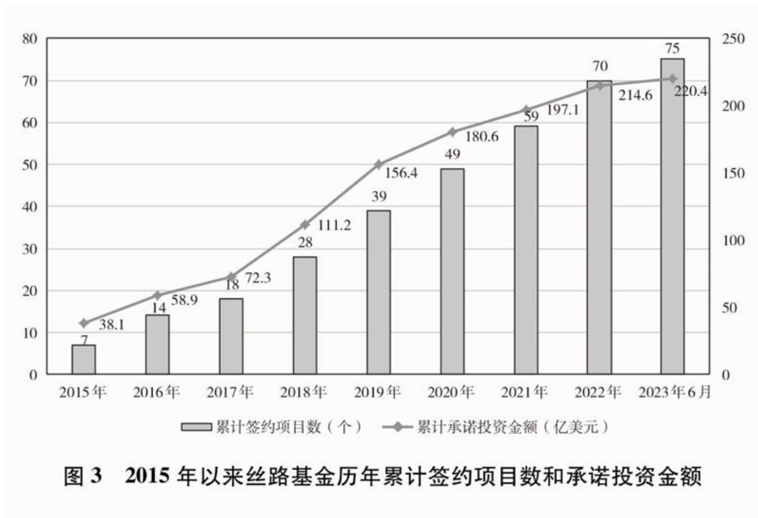
图3 2015年以来丝路基金历年累计签约项目数和承诺投资金额

投融资渠道平台不断拓展。中国出资设立丝路基金，并与相关国家一道成立亚洲基础设施投资银行。丝路基金专门服务于“一带一路”建设，截至2023年6月底，丝路基金累计签约投资项目75个，承诺投资金额约220.4亿美元；亚洲基础设施投资银行已有106个成员，批准227个投资项目，共投资436亿美元，项目涉及交通、能源、公共卫生等领域，为共建国家基础设施互联互通和经济社会可持续发展提供投融资支持。中国积极参与现有各类融资安排机制，与世界银行、亚洲开发银行等国际金融机构签署合作备忘录，与国际金融机构联合筹建多边开发融资合作中心，与欧洲复兴开发银行加强第三方市场投融资合作，与国际金融公司、非洲开发银行等开展联合融资，有效撬动市场资金参与。中国发起设立中国—欧亚经济合作基金、中拉合作基金、中国—中东欧投资合作基金、中国—东盟投资合作基金、中拉产能合作投资基金、中非产能合作基金等国际经济合作基金，有效拓展了共建国家投融资渠道。中国国家开发银行、中国进出口银行分别设立“一带一路”专项贷款，集中资源加大对共建“一带一路”的融资支持。截至2022年底，中国国家开发银行已直接为1300多个“一带一路”项目提供了优质金融服务，有效发挥了开发性金融引领、汇聚境内外各类资金共同参与共建“一带一路”的融资先导作用；中国进出口银行“一带一路”贷款余额达2.2万亿元，覆盖超过130个共建国家，贷款项目累计拉动投资4000多亿美元，带动贸易超过2万亿美元。中国信保充分发挥出口信用保险政策性职能，积极为共建“一带一路”提供综合保障。