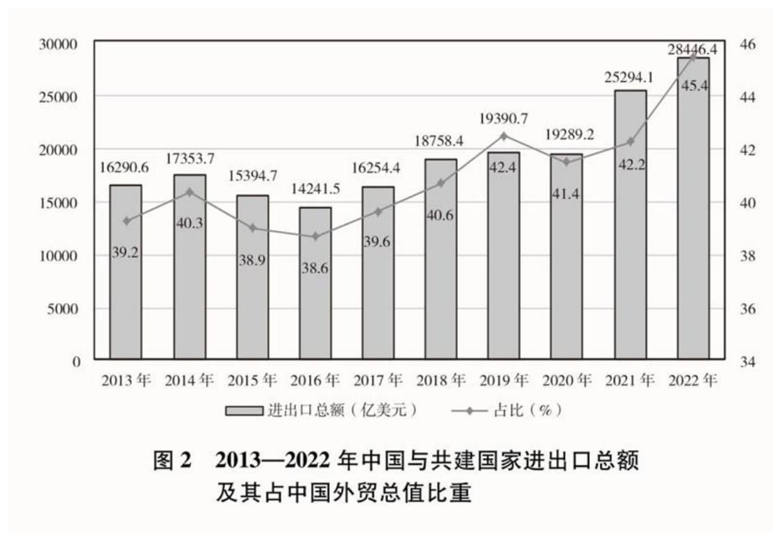
图 2 2013—2022 年中国与共建国家进出口总额及其占中国外贸总值比重

贸易投资规模稳步扩大。2013—2022年，中国与共建国家进出口总额累计19.1万亿美元，年均增长6.4%；与共建国家双向投资累计超过3800亿美元，其中中国对外直接投资超过2400亿美元；中国在共建国家承包工程新签合同额、完成营业额累计分别达到2万亿美元、1.3万亿美元。2022年，中国与共建国家进出口总额近2.9万亿美元，占同期中国外贸总值的45.4%，较2013年提高了6.2个百分点；中国民营企业对共建国家进出口总额超过1.5万亿美元，占同期中国与共建国家进出口总额的53.7%。